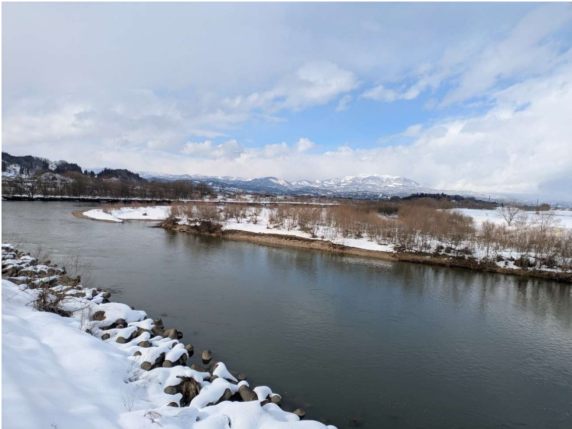
取水塔から望む最上川