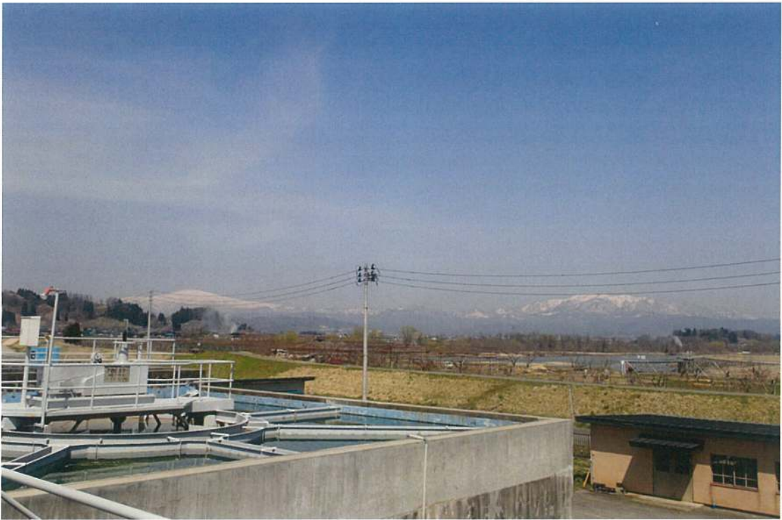
企業団浄水場からの最上川